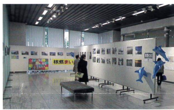
▲2022年度の会場の様子